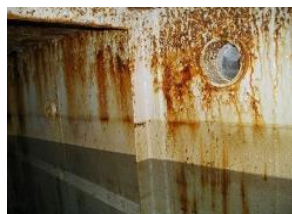
タンク内部に鉄サビや藻が発生