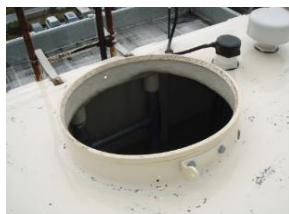
マンホールやタンクが破損