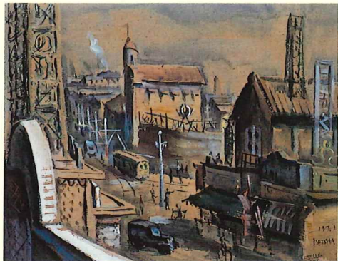
別車博覧《湊川トンネル西口》1932年