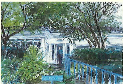
西村功《ホワイトハウス》1988年