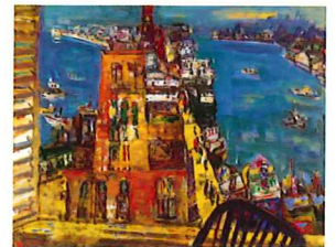
角卓《艶景(神戸)》1969年 油彩・キャンバス