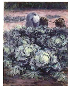
川端謙次《キャバツ畑》1983年 油彩・キャンバス