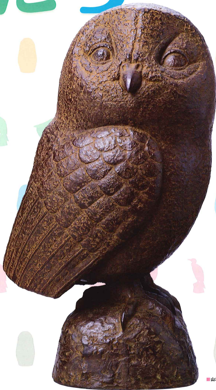
■山本常一《夜 朝が来る》1986年 ブロンズ