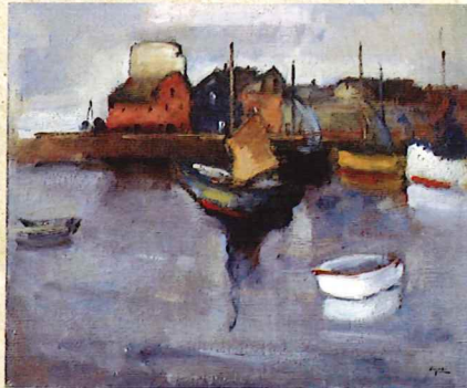
大森啓助「ブルターニュ、コンカルノーの港」 1929年 油彩・キャンバス 神戸市立博物館蔵