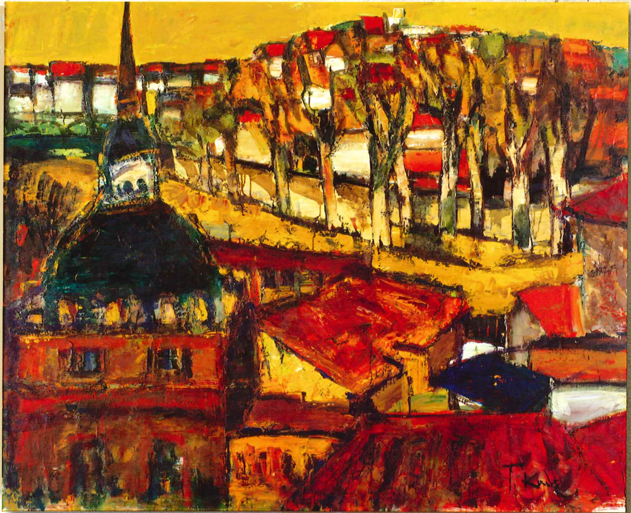
角卓「丘陵の街(スペイン)」1964年 油彩・キャンバス 当館蔵