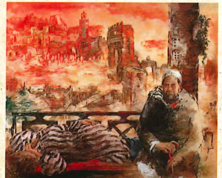
長尾 和「丘の人たち(モロッコ)」 1996年 油彩・キャンバス 当館蔵