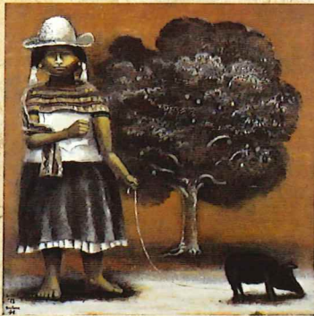
中西 勝「棲う(女・木・豚)」 1981年 油彩・キャンバス 神戸市立博物館蔵