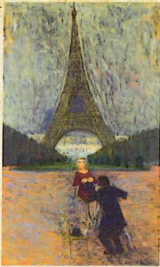
西村 功「エッフェル塔を望む」 1971年 油彩・キャンバス 当館蔵

画家たちは、それぞれの志しや想いを胸に、海外へ旅立ちました。ある者は、本格的な油彩技法を学ぶために渡欧し、またある者は、異国の街並みや人々の営みに関心を寄せ、欧米諸国だけでなく、アジアや中央アメリカ、北アフリカなど世界各地を巡りました。日本とは全くことなる文化や慣習を持つ異国の地で、画家たちは「エトランゼ(異邦人)」としてその眼に映る風景を描きました。本展は、画家たちを魅了した異国風景を追体験する旅に誘います。