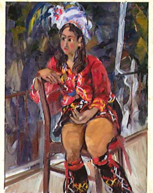
山本萬司「鴉来の姑娘」 制作年不詳 油彩・キャンバス 当館蔵

また、隣接する神戸ファッション美術館で同時期に開催する特別展示「世界のファッションー100年前の衣装と写真は語るー」をあわせてご覧になることで、絵画・ファッション・写真を通して世界の文化を体感いただけます。