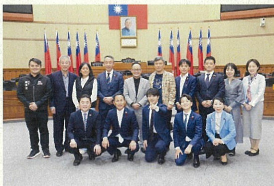
基隆市 基隆市議会議長と会談 11月24日