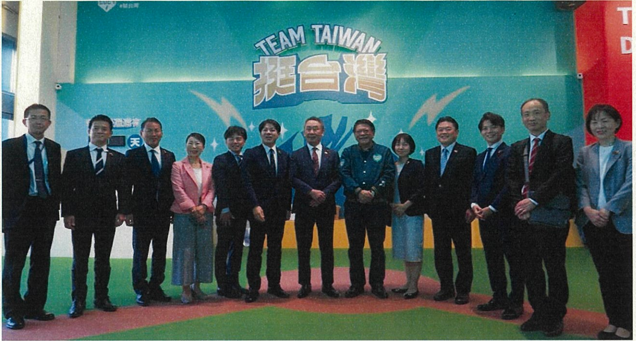
藩前屏東県知事と