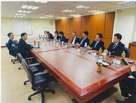
台北市 外交部 台湾日本関係協会で会談 11月23日