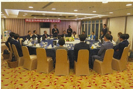
僑務委員会 副大臣と会談・意見交換会 11月24日