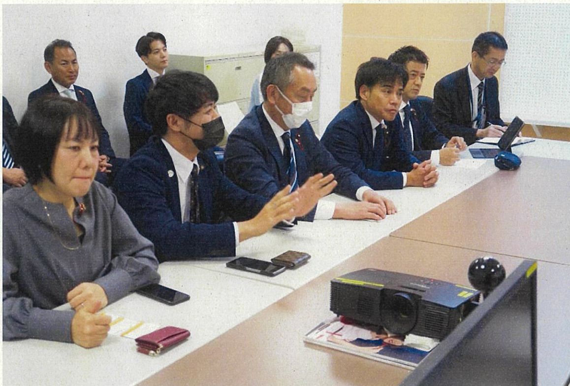
タイガーエア社との意見交換