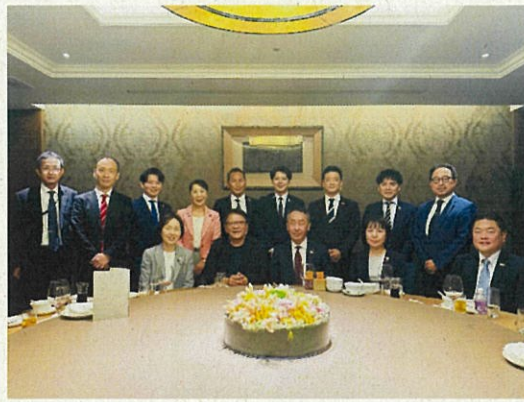
台北市 民進党 潘孟安（前屏東県知事）表敬訪問 11月23日