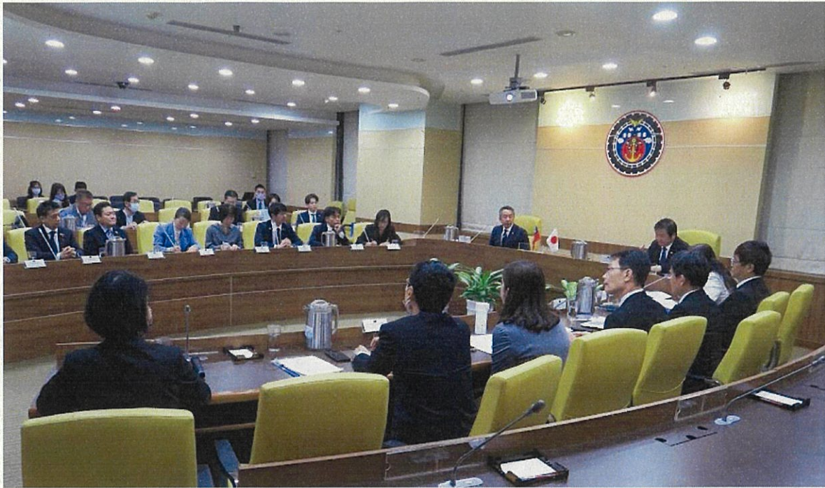
交通部との意見交換