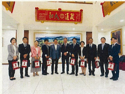
新竹県 新竹県政府 知事と会談・意見交換会 11月23日