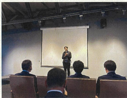
桃園市 横山書法芸術館 視察・意見交換会 11月25日