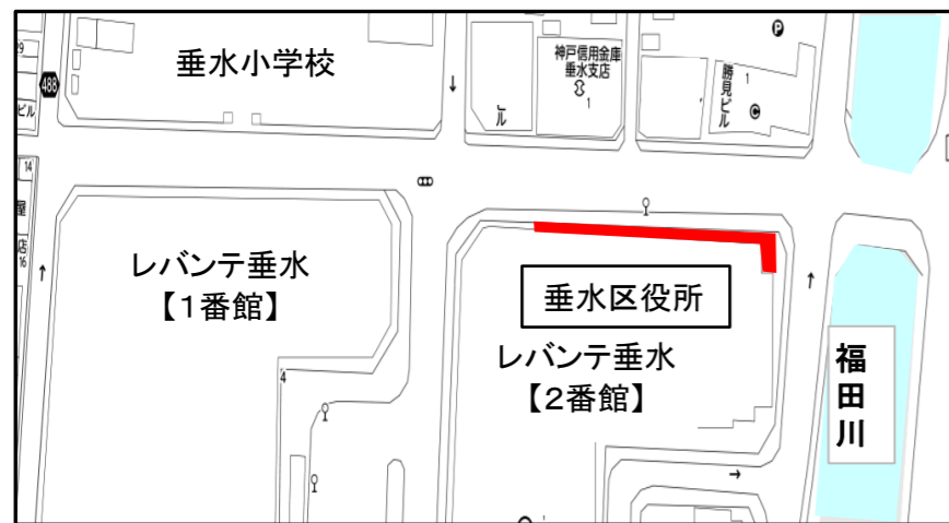
自転車 No.17 ~ No.81