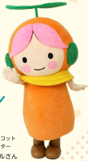
北区マスコットキャラクター キタールさん

地域みんなから困りごとや心配ごとを聞いて、助けてくれる人や場所を紹介する「つなぎ役」なんだって。子どもから大人までみんなと関わって、「支えあうまちづくり」をしているんだよ。