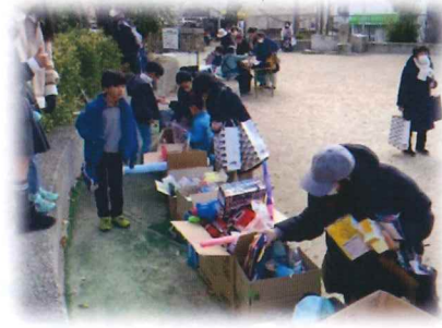
たすけあいバザー