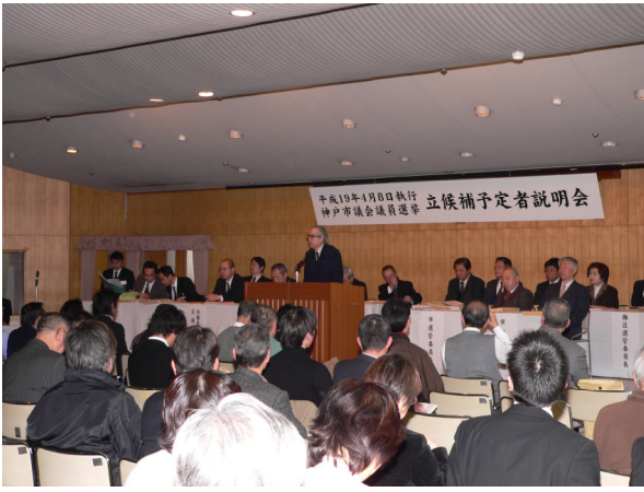
○ 立候補予定者説明会