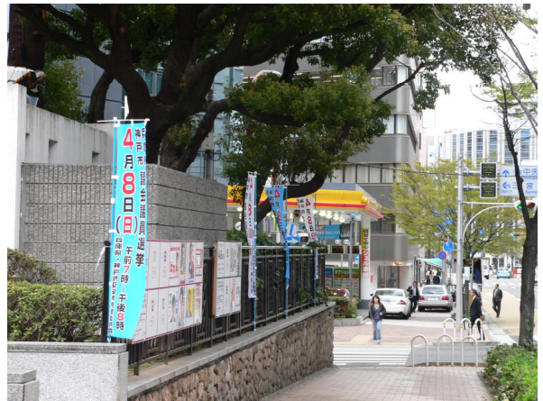
○ 花時計周辺のぼり