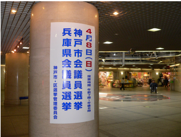
○ デュオ神戸ポスター