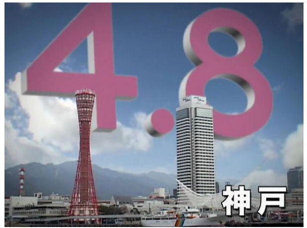
○ 3都市協同制作 JR 車内映像広告