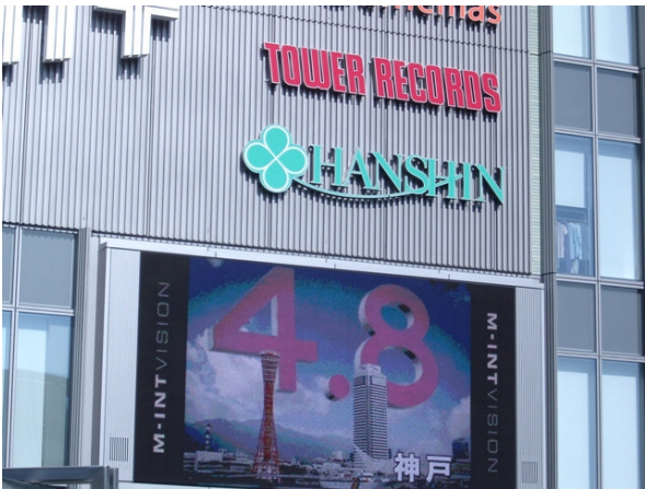
○ ミント神戸電光掲示板