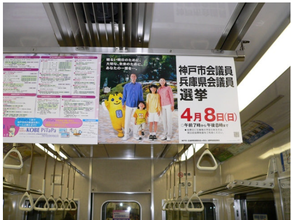
○ 地下鉄車内吊広告