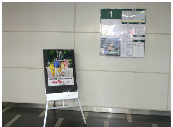
○ しゃべるポスター