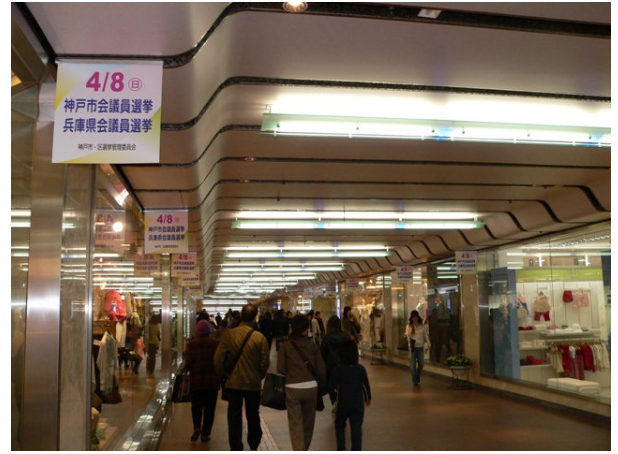
○ さんちかペナント