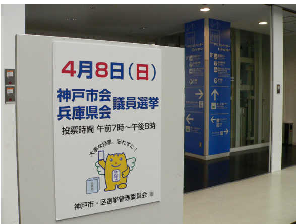
○ 神戸空港ポスター