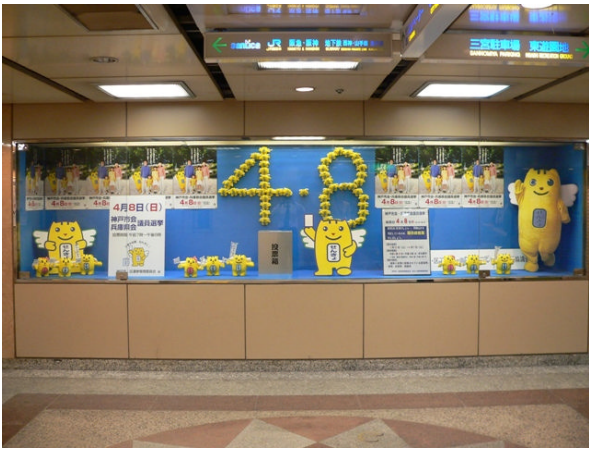
○ さんちかアドウィンドー啓発パネル