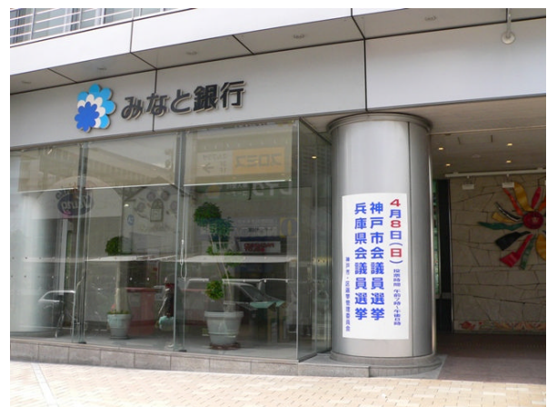
○ 交通センタービルポスター