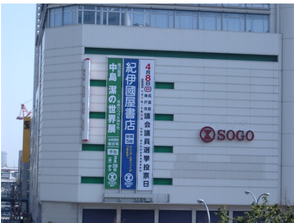
○ 三宮そごうビル壁面広告