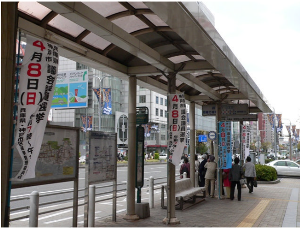
○ 市バス停留所のぼり