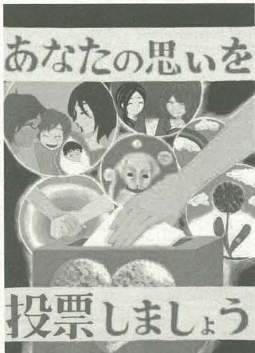
平成24年度明るい選挙をすすめるポスターコンクール 特選 神戸市立淡河中学校3年 上山千波さんの作品