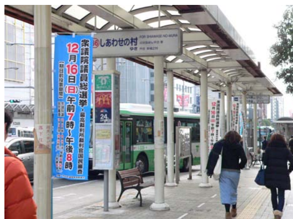
○市バス停留所のぼり