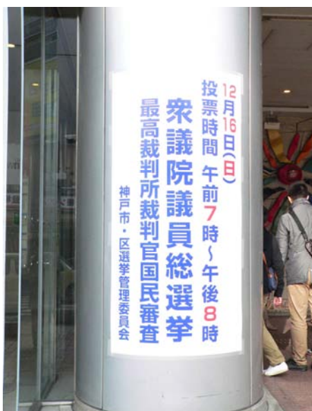
○交通センタービル看板