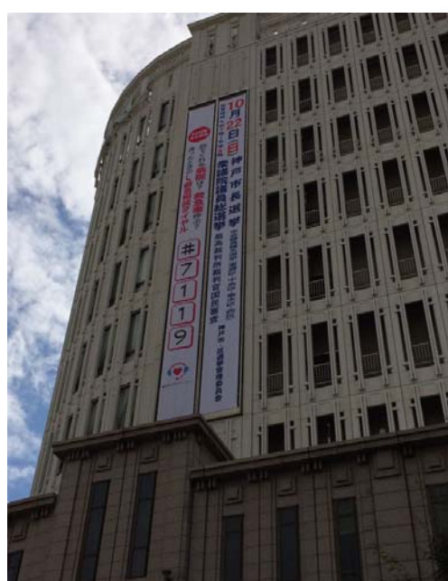
○大丸神戸店壁面懸垂