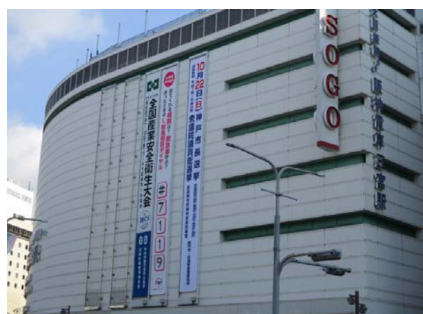
○そごう神戸店壁面懸垂幕