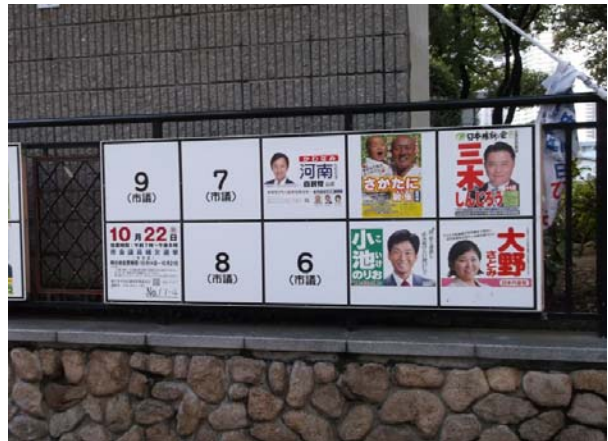
○ポスター掲示場(市会補欠)