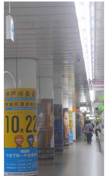
○市営地下鉄駅構内広告