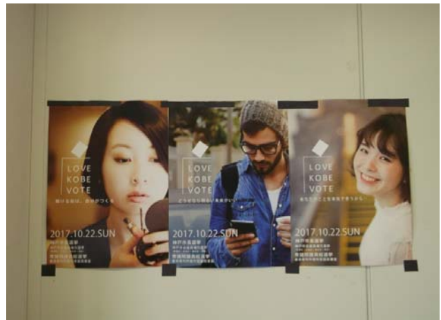
○市作成啓発ポスター