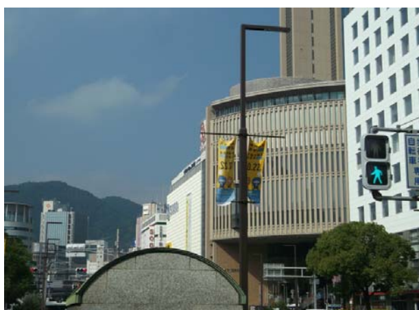
○フラワーロードバナー