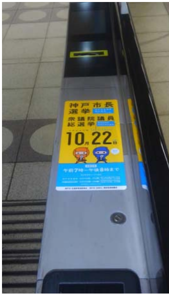
○市営地下鉄駅改札ステッカー