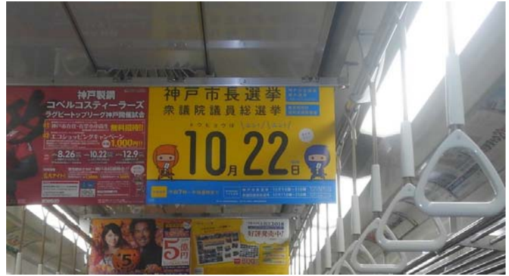
○市営地下鉄車内吊広告