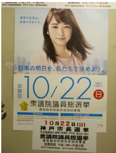
○衆議院ポスター・マグネットシート