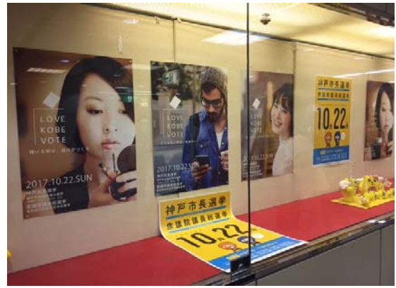
○さんちかアドウインドー