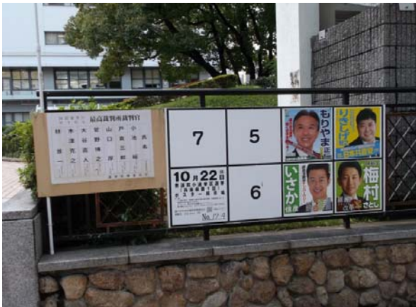
○ポスター掲示場(衆議院)