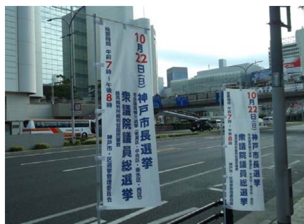
○三宮駅前付近のぼり