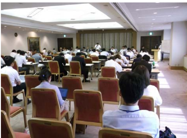
○立候補予定者説明会(市長・市会補欠)