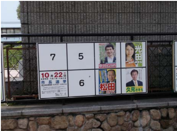
○ポスター掲示場(市長)