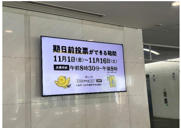
市役所1号館デジタルサイネージ