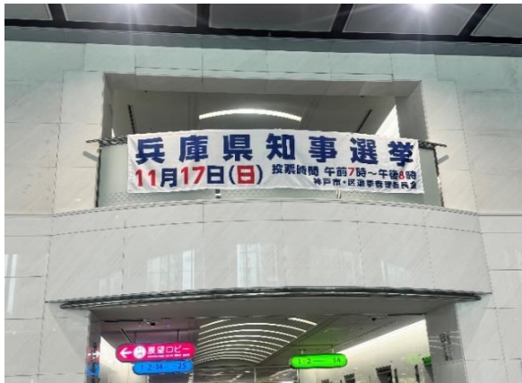
市役所1号館玄関横断幕