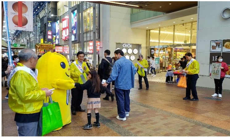
三宮センター街街頭啓発