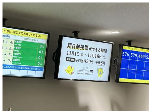
区役所窓口モニター