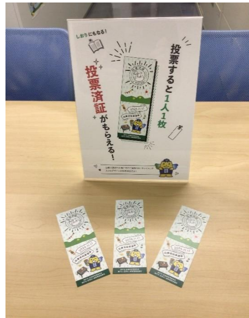
しおり型投票済証