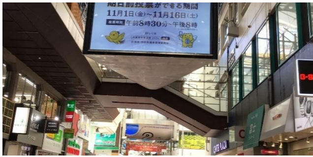
三宮センター街BOSビジョン