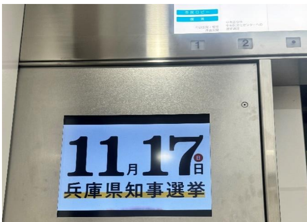
市役所エレベーター内モニター