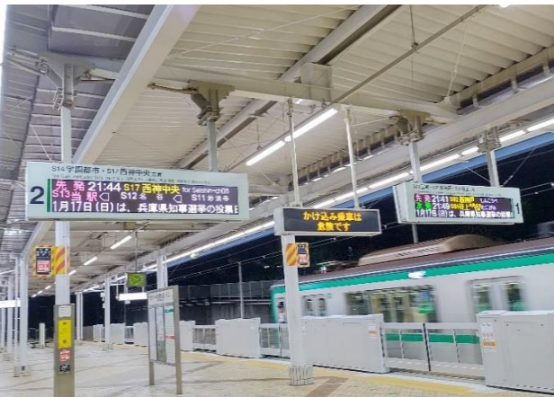
地下鉄駅ホーム電光掲示板