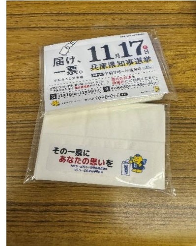
ポケットティッシュ