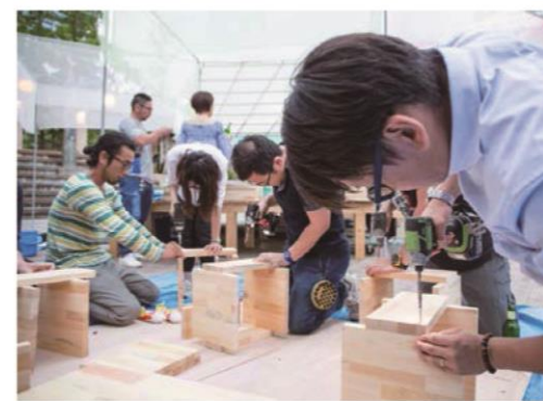
育てるプログラム 『ベンチに机をつくろう』