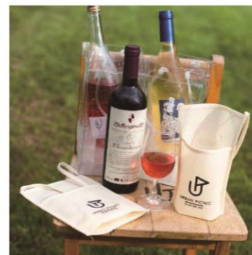
自主プログラム 『ワインピクニック』