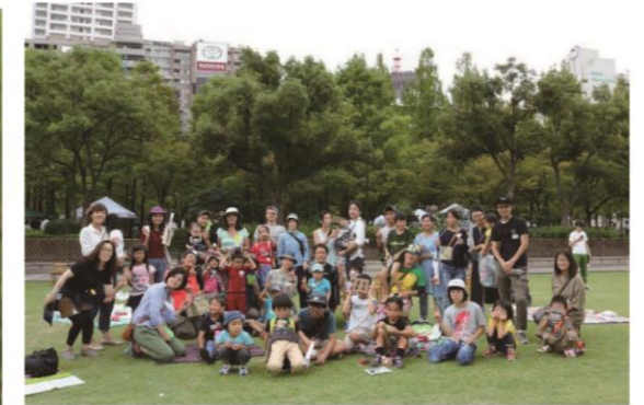
公募プログラム+育てるプログラム 『asobi 基地』『asobi 基地運営サポート』