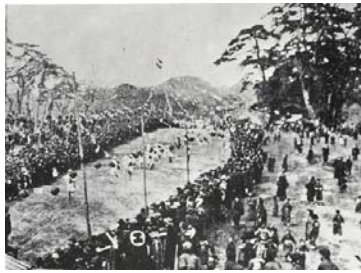
大会当日のスタート直後

会場となった鳴尾競馬場には、約六万人の観衆が詰めかけました。予選は、競馬場を十周したタイムで競い、二十人の出場選手が決まりました。