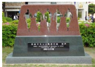
日本マラソン発祥の地記念碑

神戸マラソンは、「阪神・淡路大震災からの復興を支えていただいた国内外の人々や地域へ感謝の気持ちを込めて」ということから、大会テーマとして「感謝と友情」を掲げています。また、国内外の被災地を支援する「神戸マラソンフレンドシップバンク」を設立し、今年度は、