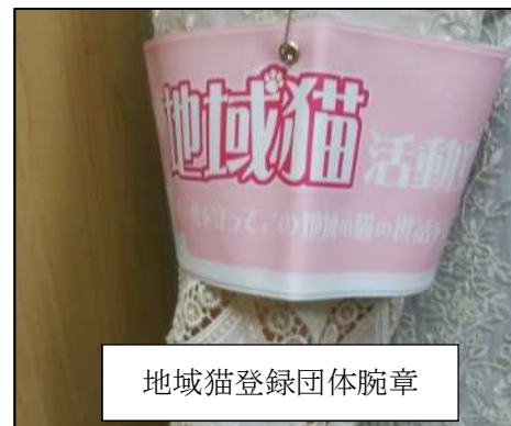
地域猫登録団体腕章