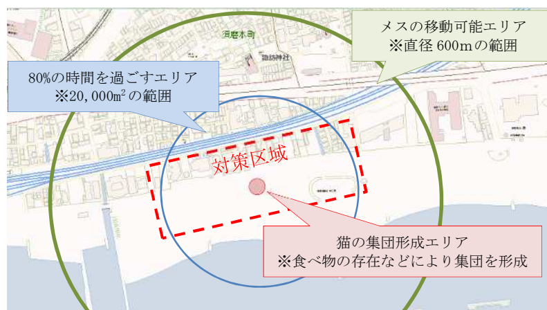
<対策区域（案）の策定>

メス猫の移動可能エリアのうち、餌場等を中心とした半径 80 メートルのエリア (20,000m 2 の範囲) を猫の活動エリアと考え、道路、河川、鉄道等を加味して繁殖制限対策区域を策定することとしており、事前調査の結果に基づき、協議会事務局が対策区域案を策定する。