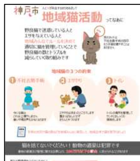
地域猫活動啓発リーフレット

本市では一定の条件を満たす団体を地域猫活動団体として登録を行っており、責任をもって地域猫活動を行う証として腕章を交付した。令和元年度の登録団体数は 140 団体 であった。地域猫活動登録団体へは、1 年に 1 度、活動状況を市へ報告することを義務付けている。