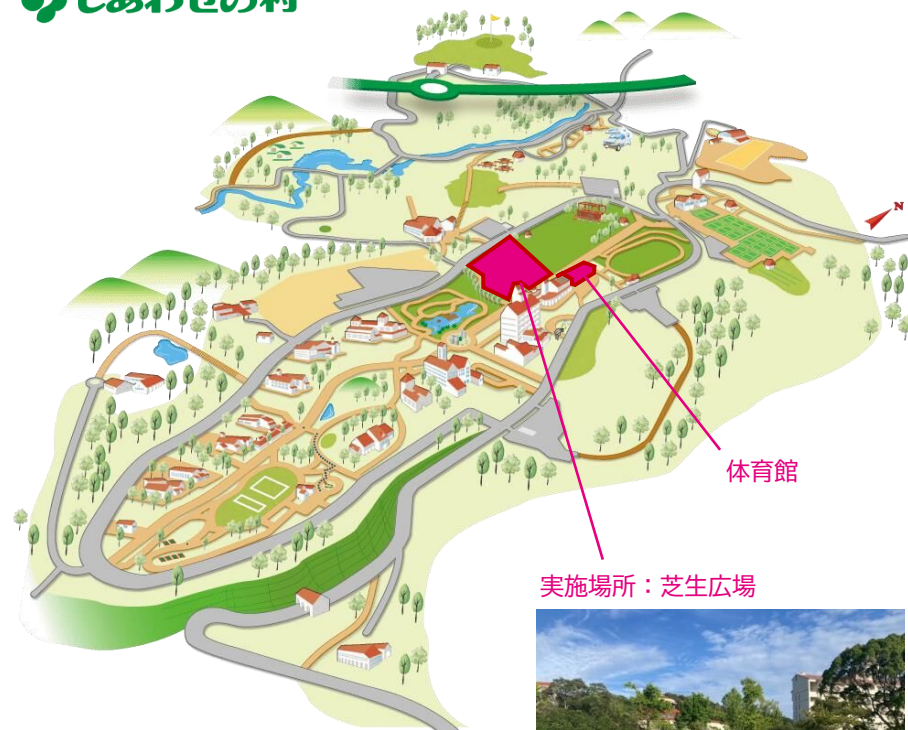
実施場所：芝生広場