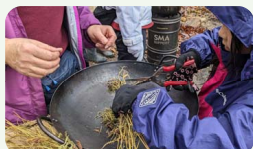
カワラケツメイ茶の準備