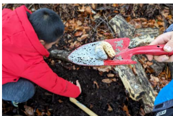
甲虫類の幼虫がたくさん!