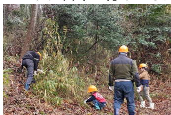
ササがなくなり、すっきり見通しが良くなりました

活動広場まわりの森を、子どもたちを安心して遊ばせられる場所にします。森の中に道を作るため、ルートに目印を付けました。ササの刈り取りも実施。