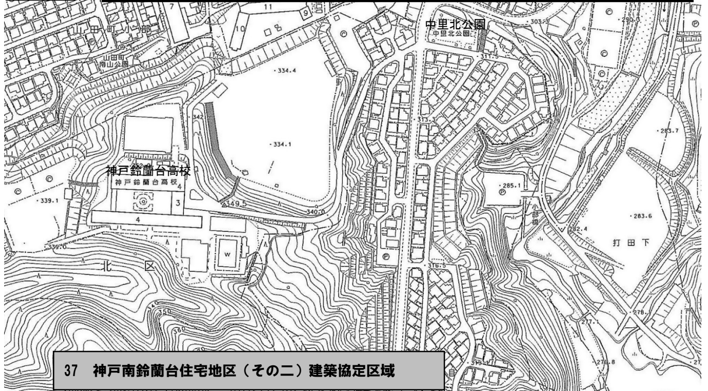
37 神戸南鈴蘭台住宅地区(その二) 建築協定区域