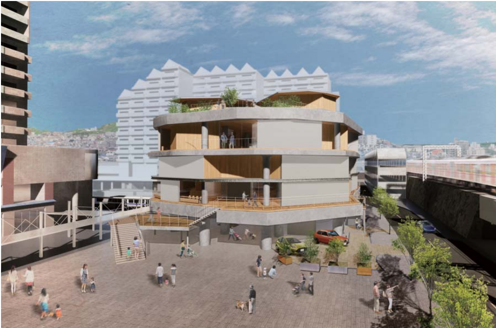
パース：西から東向き ※パースはイメージであり、今後変更することがあります