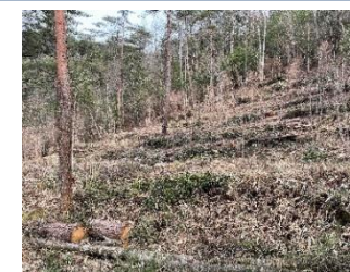
【県民緑税事業による森林整備】