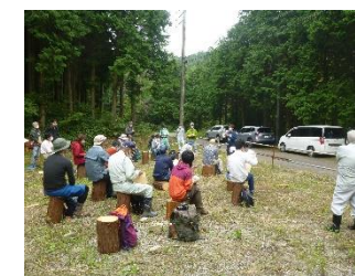
【森林所有者、木材事業者らとの研究会】