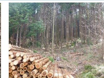
【森林環境譲与税による森林整備】