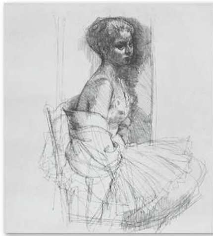
小磯良平 《椅子にかけけるバレリーナ》 1968-69年 エッチング・紙 当館蔵