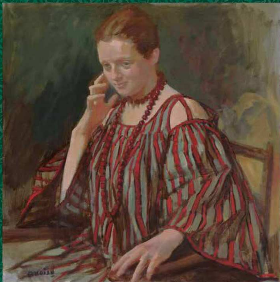
小磯良平 《西洋婦人図》 1972年頃 油彩・キャンバス 当館蔵