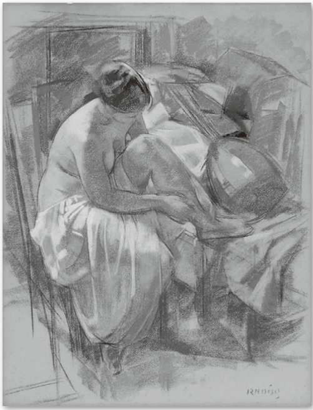
小磯良平 《裸婦》 1959年頃 パステル・紙 当館蔵