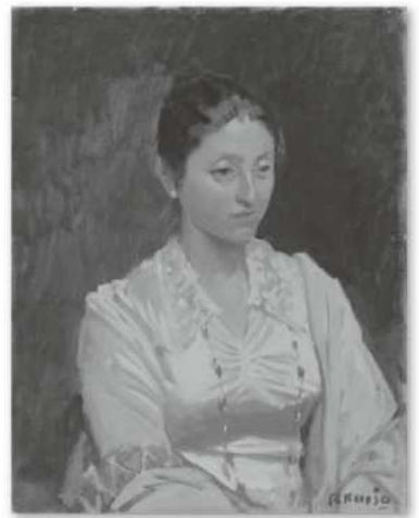
小磯良平 《婦人像》 1978年頃 油彩・キャンバス 当館蔵