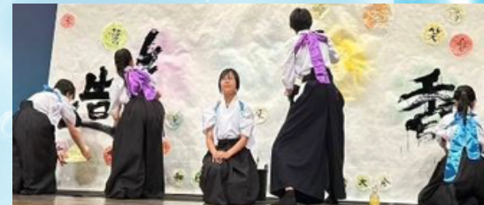
書道パフォーマンス (4/25のみ)

主催：(公財)兵庫県スポーツ協会 兵庫県立海洋体育館 共催：兵庫県阪神南県民センター 阪神南青少年本部 後援：芦屋市 西宮市 芦屋市教育委員会 西宮市教育委員会 協力：関西龍舟 チームバナナ ホビー協会 芦屋マルチ会 県立芦屋高等学校ヨット部・カヌー部・書道部 県立国際高等学校カヌー部 箕面学園高等学校カヌー部 芦屋国際中等教育学校カヌー部 関西学院大学体育会カヌー部 ※順不同