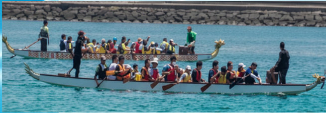
ドラゴン (10人乗) 4/26のみ