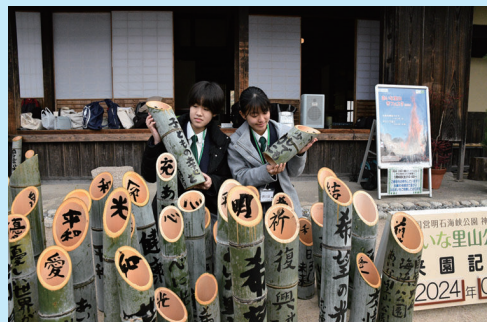
思いの込められた竹灯明台は 「1.17つどい」の会場である 東遊園地へ運ばれます