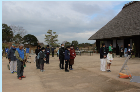
10:00~セレモニー開始 黙とうを捧げます