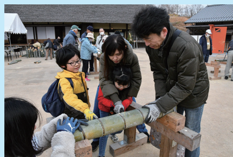
節を残すよう50cm程度に斜めに のこぎりで切り揃えます