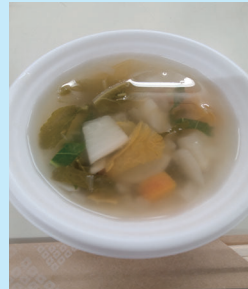
寒い中、お疲れさまでした 暖かいふるまいをご用意 しています (数に限りがあり ご了承ください)