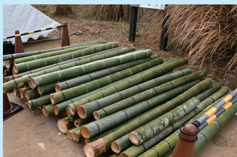
園内の竹林から切り出した竹