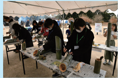
思い思いの言葉を墨で筆入れします