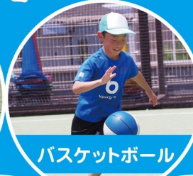
バスケットボール