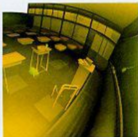
佳作賞「2000, 終 NO. (1)」貞栗健一