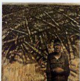
佳作賞「掲げて来た道-父の時代-」藤中 健