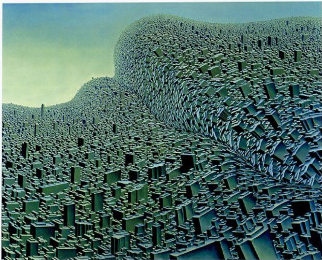
大賞「生命都市シリーズ2000 五の向うI」 小磯良平