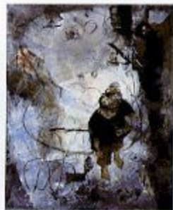
佳作賞「夢一隅」トビ俊孝