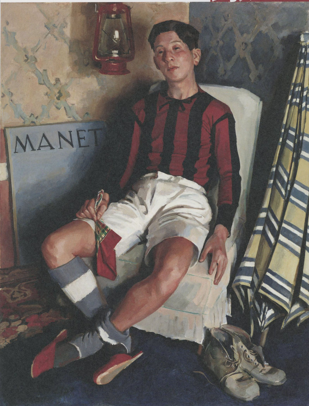
小磯良平「彼の休息」1927年 油彩 キャンベス 東京藝術大学蔵