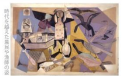
猪熊弦一郎『からす』1953年 油彩・キャンバス 丸亀市美術館—一部現代美術館のThe MIMOCA Foundation