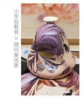
ちうたろう／前光太郎『つゆみ』2022年 陶板 作家蔵