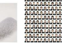
澤田知子『Recruit/Black』2004年 100 Omrogami paper タグアートコレクション/タグアート現代美術館蔵

■展示作家 野田／相笠昌景／会田誠／朝倉拱／猪熊弦一郎／内田誠／梅宮馨一郎／海老原真之助／大森哲也／尾田健／桂川寛／北川次／小磯良平／ちうたろう（前光太郎）／澤田知子／新海寛隆／菅原光人／須田寿／高山良策／田中忠雄／長尾和／中谷登／中村宏／西村功／野見山晴治／真鍋博／宮本三郎／やなぎみわ／協田和（五十音順）