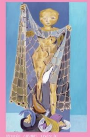
藤田恒久『働く人びと』1952年 油彩・キャンバス 福岡市美術館蔵