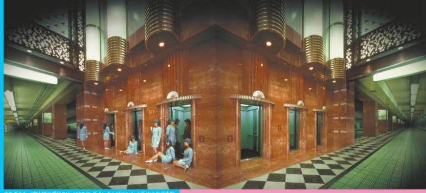
やなぎみわ『箱の中の部屋 Ⅱ』1997年 ダイレクトプリント 大塚中之島美術館