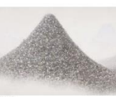
会田誠『灰色の山』2009年 油彩・キャンバス タグアートコレクション/タグアート現代美術館蔵 ©ANDA Makoto Courtesy of Moema Art Gallery