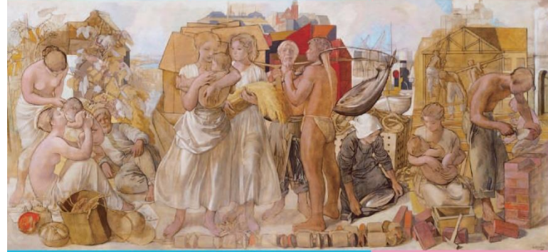
小磯良平『働く人びと』1953年 油彩・キャンバス 神戸市立小磯記念美術館蔵

神戸市立小磯記念美術館 Kobe City Koiso Memorial Museum of Art