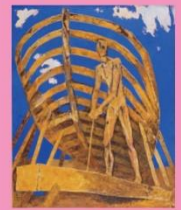
海老原真之助『働く人びと』1954年 油彩・キャンバス 北川市美術館蔵

■主催：神戸市立小磯記念美術館、神戸新聞社 ■協賛：一般財団法人みなと森行文化振興財団 ■後援：神戸新交通株式会社、NHK 神戸放送局、サンテレビジョン、ラジオ関西 ■観覧時間：午前10時～午後5時（入館は午後4時30分まで）/ 休館日：10月10日（火）/ 10月10日（月）は開館 / 入館料：一般：1000（800）円・大学生：500（250）円 ※（ ）内は20名以上の団体料金・高校生以下無料（学生証、生徒手帳などをご提示ください）・神戸市在住の65歳以上の方：500円（住所と年齢が証明できるものをご提示ください）障がい者手帳、またはスマートフォンアプリ「ミライロID」をご提示で無料 / 神戸ゆかりの美術館、「神戸ファッション美術館」へは、当日入館券（半券）のご提示により、割引料金で入館できます。