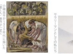
小磯良平『変り』1954年 油彩・キャンバス 福岡市美術館蔵