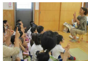
ボランティアグループによるおはなし会