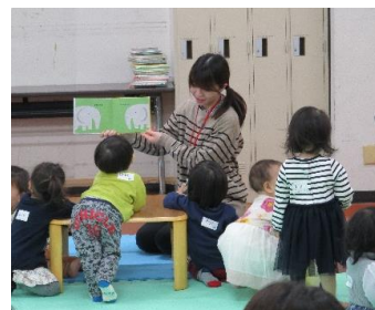
乳幼児と保護者向け絵本講座