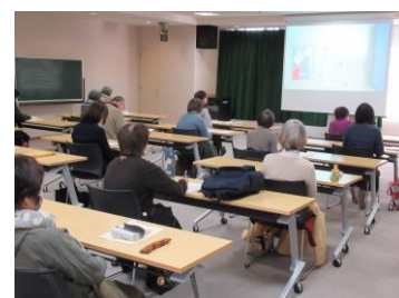
ボランティアへの近刊紹介