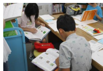
調べ学習応援講座