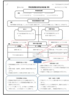
活用促進のための計画作成