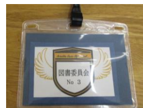
委員章でやる気アップ