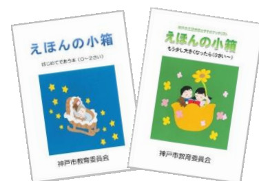
ブックリスト「えほんの小箱」