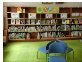
整備された学校図書館