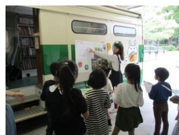
図書館バックヤードツアー