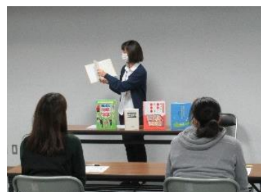
「ブックトーク」自主研修会