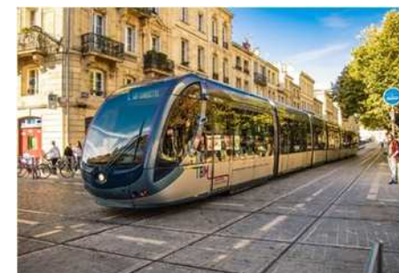
⑦ フィレンツェ (イタリア)