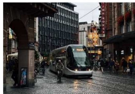
② ストラスブール (フランス)