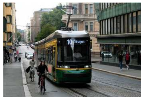
④ ヘルシンキ (フィンランド)