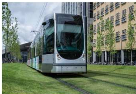
① ロッテルダム (オランダ)