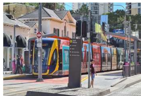
③ ゴールドコースト (オーストラリア)