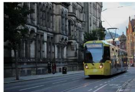
⑤ マンチェスター (イングランド)