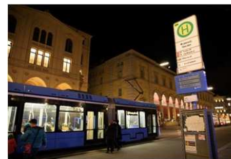
⑧ ミュンヘン (ドイツ)