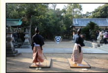
Đền Okubata Otoshi

Quận Tarumi: Đền Okubata Otoshi Ngày 11/2 14:00~15:00