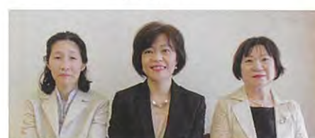
円谷 谷川 延命寺