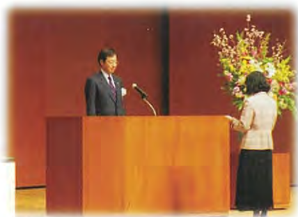
入学生代表が力強く抱負を！