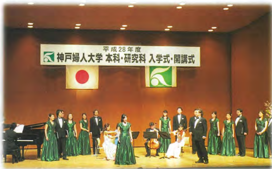
ウェルカムコンサート 神戸市混声合唱団と神戸市室内合奏団