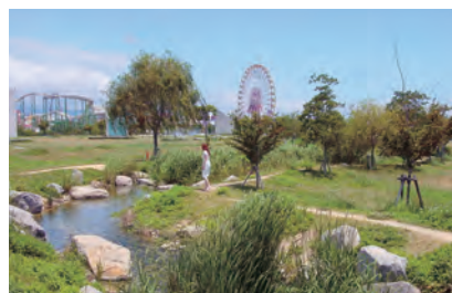
▲中央公園せせらぎ