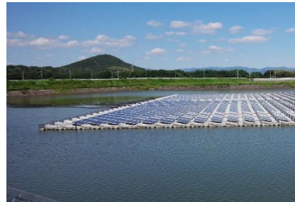
農業用ため池の太陽光発電設備