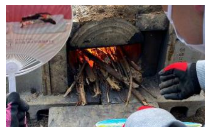
北区里山におけるバイオ炭作成