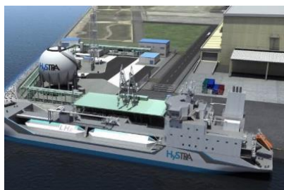
液化水素の荷揚基地

そして、コンテナターミナルにおいては、燃料電池へ換装可能な新型 RTG(タイヤ式門型クレーン)導入が本格化するなか、荷役機械やトラクターヘッド等の輸送車両などへの水素供給を見据え、CNP 形成に資する水素ステーション等の誘致を進める。