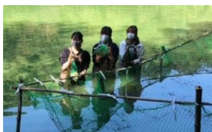
淡水ブルーカーボンの移植実証