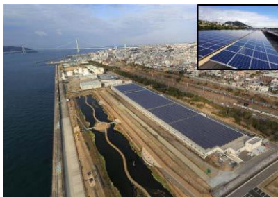
垂水処理場の太陽光発電設備