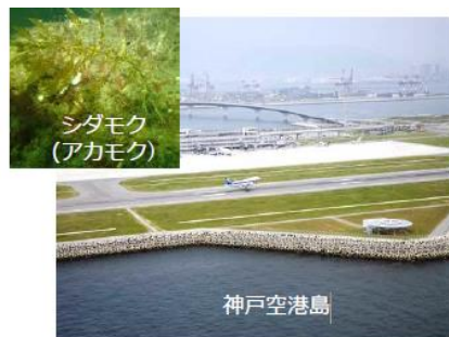
海域のブルーカーボンイメージ

また、藻場等の育成により豊かな里海環境を保全するとともに、新たな二酸化炭素吸収源として注目されるブルーカーボンの取り組みを全庁横断的に進め、本市が目指す「海と山が育むグローバル貢献都市」の実現に向けて取り組む。