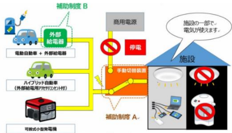
外部給電・神戸モデルのイメージ