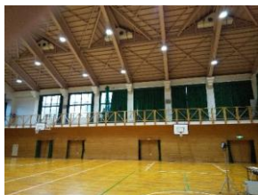
EVから避難所等への天井照明へ給電