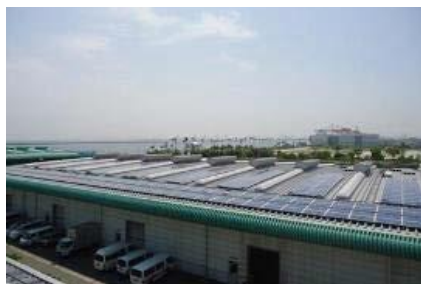
臨海部の屋根上太陽光発電設備

また、障害物が少なく造成が不要な農業用ため池や公共施設等において、太陽光発電の適地調査を進めるとともに、軽量のフィルム型パネルなど新たな技術の積極的な活用も研究し、再生可能エネルギーの普及を促進する。