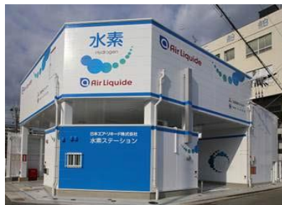
七宮の水素ステーション