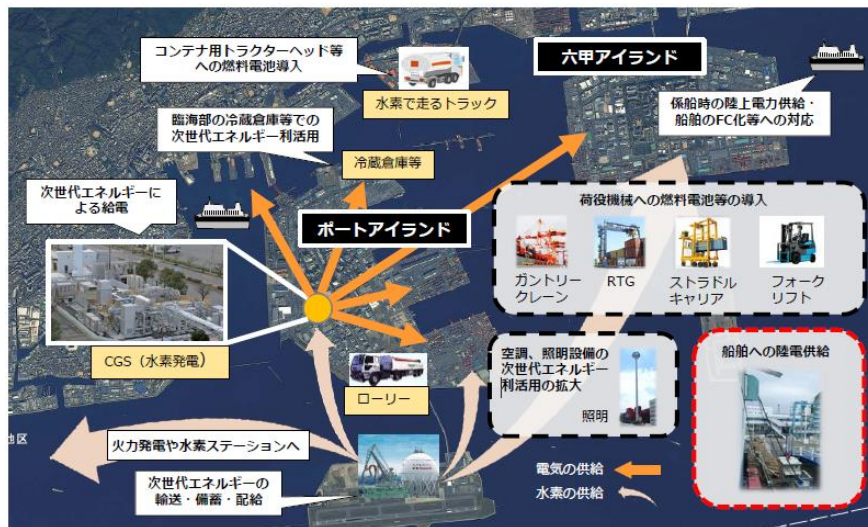
神戸港におけるCNP形成イメージ