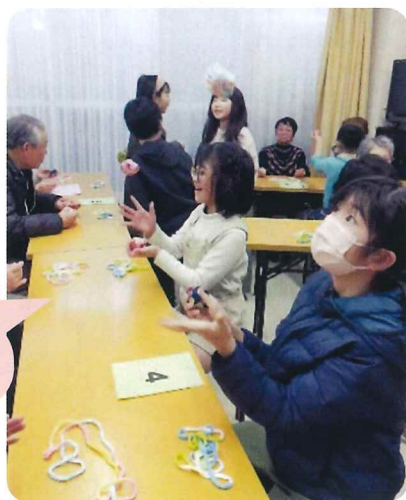
子供たちとの交流会

民生委員による一人暮らし高齢者の食事会を、月に一度開催しています。平均年齢78歳。皆様大変お元気で、私達もお会いするのが楽しみです。 また、年に一度、地域の子供たちとの交流会で、昔遊びと題しておじいちゃん、おばあちゃんからいろいろ教えていただきました。今回はお手玉、あやとり、折り紙などです。子供たちはゲームと違って、とても新鮮に感じたのか、時のたつのも忘れて楽しそうでした。 もう一つは、もの作りの一環として、かばん（夏は保冷バッグ）の外側をシールや絵で自分たちの好きなように制作しました。皆さんわいわい楽しそうでした。