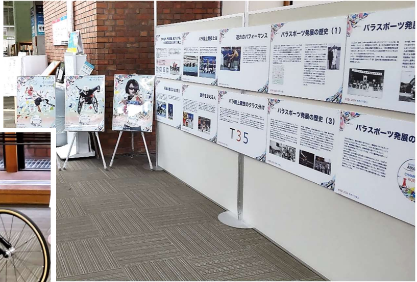
写真：KOBÉ2024 世界パラ陸上 企画展