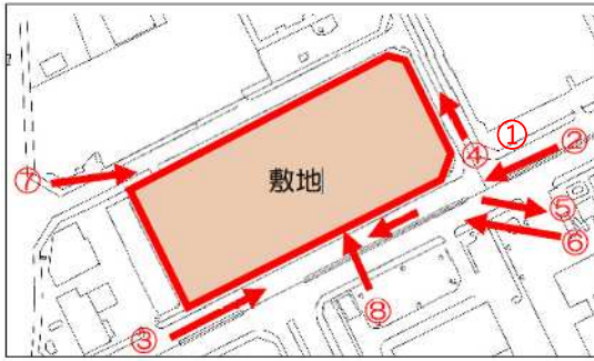
①南東角からの見え