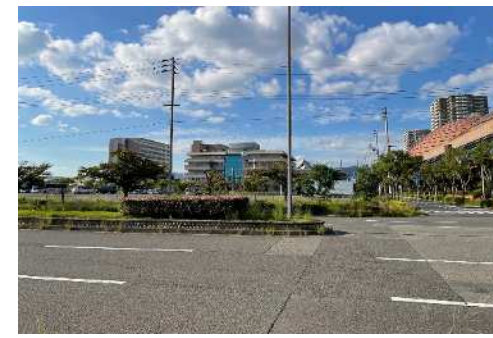
⑧南側道路からの見え