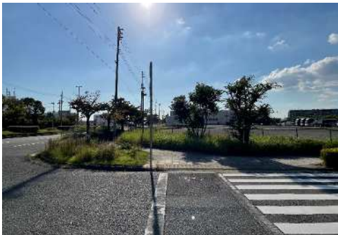
③南側道路、西側からの見え