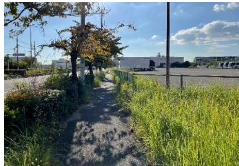
④市道 港島11号線（東側道路）からの見え