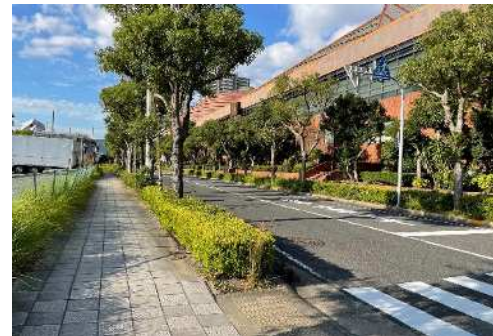
⑥南側道路からの見え