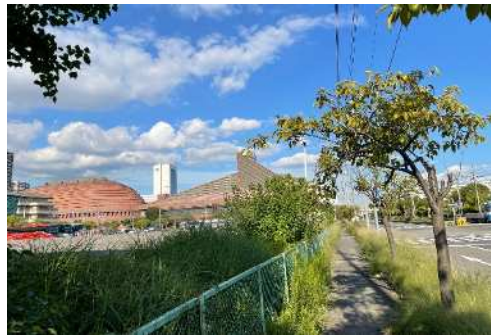
⑤東側道路と南側道路の交差点からの見え