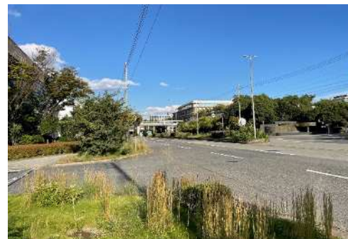
⑦北東側からの見え