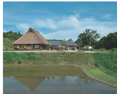
茅葺民家の保全活用

下記の取扱金融機関にてご購入いただけます。(神戸市役所では販売していません。) ご購入の際には、必要な手続きが各金融機関によって異なる場合があります。 口座管理手数料等が必要となる場合がありますので事前に取扱金融機関にご確認ください。