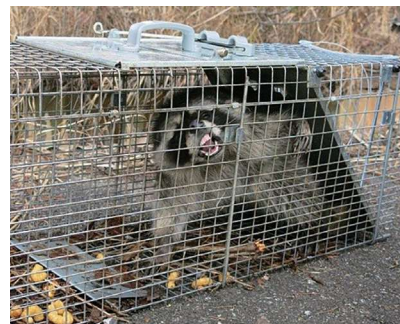
アライグマの捕獲

利子所得として20.315%(所得税・復興特別所得税 15.315%+地方税 5%)が課税されます。