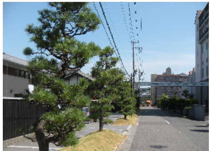
酒蔵の道(東灘区魚崎南町)