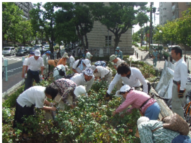
剪定実習の様子（山手街園）