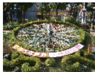
花時計の図案にも採用（H22）

今回ご紹介するのは「中央区の花 ペチュニア」です。別名ツクバネアサガオともいいます。ペチュニアとは、南米原産でナス科ペチュニア属に属する草本の総称で、サフィニアなど、たくさんの園芸品種が存在します。区の花には「色が鮮やかで、開花期が長く育てやすい。また、マンションのベランダ緑化にも適している」ことを理由に昭和62年3月に選定されました。