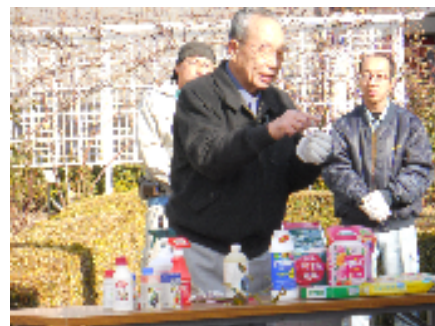
講習の様子（本山街園）