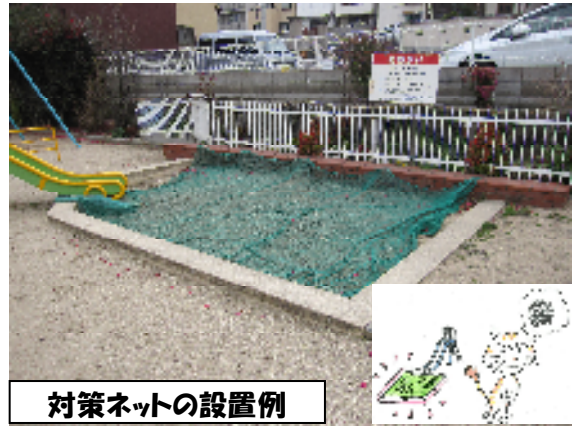
対策ネットの設置例

砂場の管理は美緑花ボランティアのメニューにも入っていますので、ネットの資材提供や設置のご相談はお近くの建設事務所までお願いします。