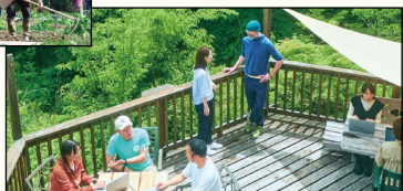
森林里的 共享办公室