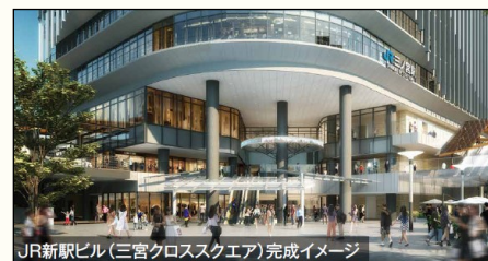
JR新车站大楼（三宫十字广场） 预计2029年竣工

三宫车站的周边，电车和巴士连接顺畅，市民和游客利用起来都很方便易懂。以三宫为起点，享受购物、观赏艺术、美食等，每次行走在此都会感到刺激和惊艳！