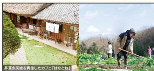
有茅草屋顶的民家咖啡 体验农业