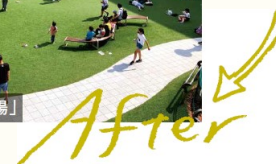
须磨庭院 「购物广场」