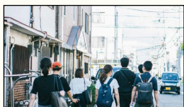
长田区的新聚集地