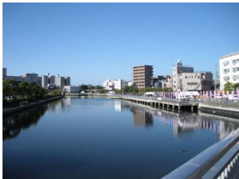
入江橋からのぞむ新川運河