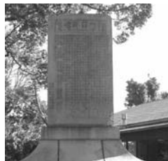
神田兵右衛門顕彰碑（和田神社）

運河会社の計画は、新川運河から駒ヶ林への本線と現在の JR 兵庫駅にあたる山陽鉄道兵庫停車場までの支線の 2 本の運河を開