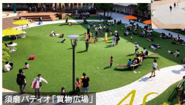
須磨パティオ「购物广场」