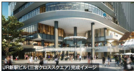
JR新车站大楼（三宫十字广场） 预计2029年竣工

三宫车站的周边，电车和巴士连接顺畅，市民和游客利用起来都很方便易懂。以三宫为起点，享受购物、观赏艺术、美食等，每次行走在此都会感到刺激和惊艳！