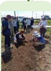
技術講習会の様子