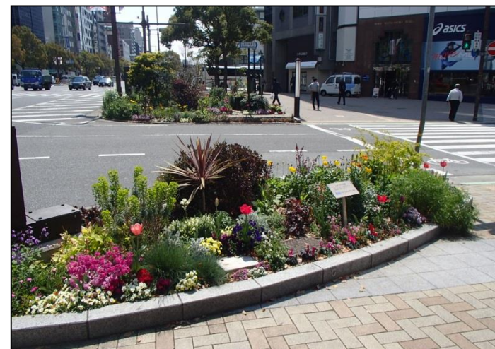
11. ブリッジメンテナンス(株)