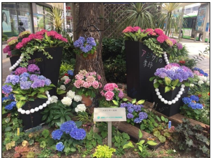
9. 日本ロードメンテナンス(株)