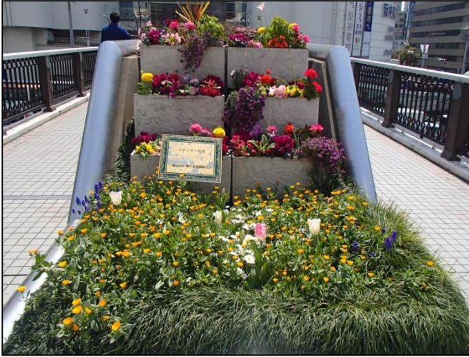
1. 一般社団法人神戸市造園協力会