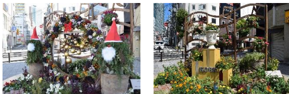
Floral Installation花壇のイメージ写真

※現在、神戸市では「自然の景」の創出による新たな緑と花のブランディングの取り組み