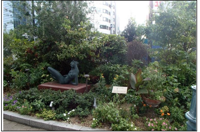
14. 三菱UFJモルガン・スタンレー証券(株)