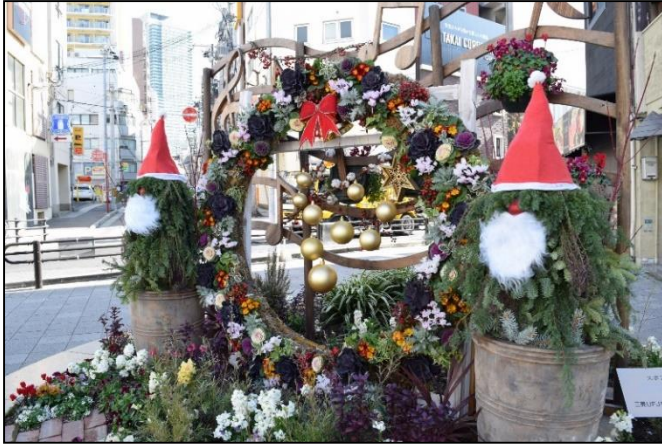
13. 三菱UFJモルガン・スタンレー証券(株)