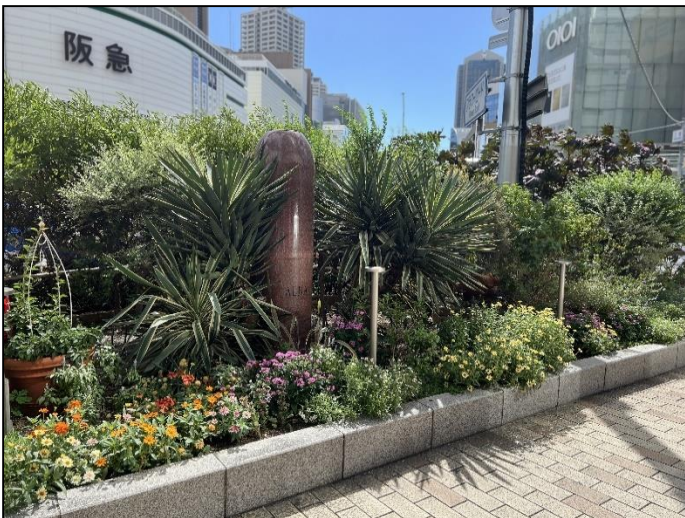
5. (株)グランビスタ ホテル&リゾート