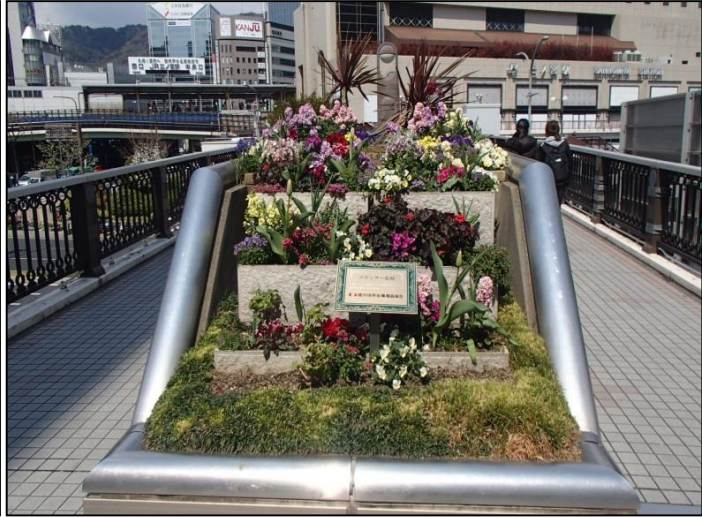
2. 播州信用金庫職員組合