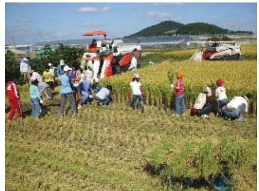
農業体験を通じた都市と農村の交流

豊かな自然環境を活かして、農村部とニュータウンの相互交流を行い、西区産の農産物の直売や、田植えなどの自然体験を通して、区の魅力を都市部に広く発信します。情操教育や西区産の食材を活かした食育により、人と人との交流や、次代を担う子どもたちの育成を図ります。