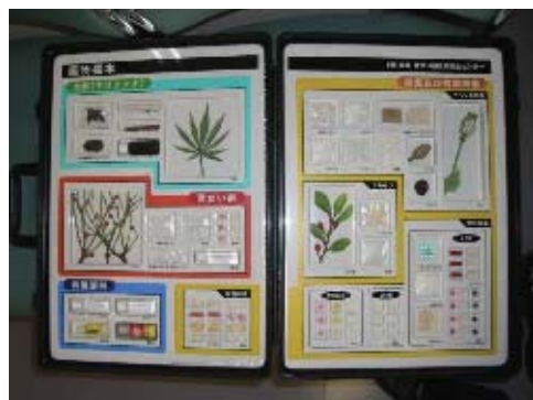
薬物乱用防止に向けた啓発

「こども 110 番 青少年を守る店・守る家」の取り組みの拡充，青少年の居場所づくり，地域パトロールの実施など青少協活動を強化するとともに，警察，学校と連携し，薬物乱用防止，携帯サイト対策などの青少年の健全育成に努めます。