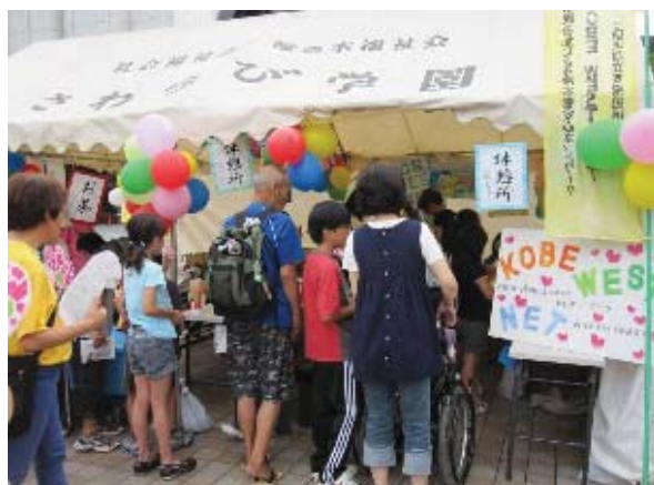
KWNはっぴ〜カーニバルでの啓発活動

KWNの事業を支援し、障害者が安心して地域で生活できるよう、福祉施設との連携を深めるための協議や研修、啓発事業などを実施するため、関係事業所と地域との結びつきを強めます。