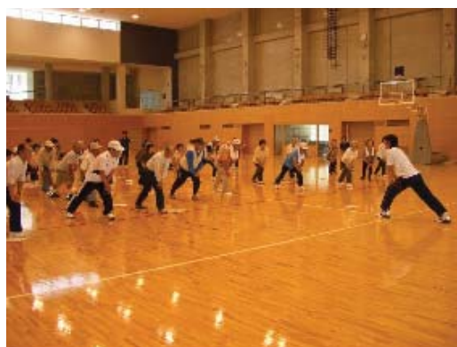
ヘルシーウォーキング研修会

生活習慣病の予防には継続的なウォーキングが効果的です。広く啓発活動を行うとともに，ウォーキンググループを育成し，住民主体の健康づくりを進めます。