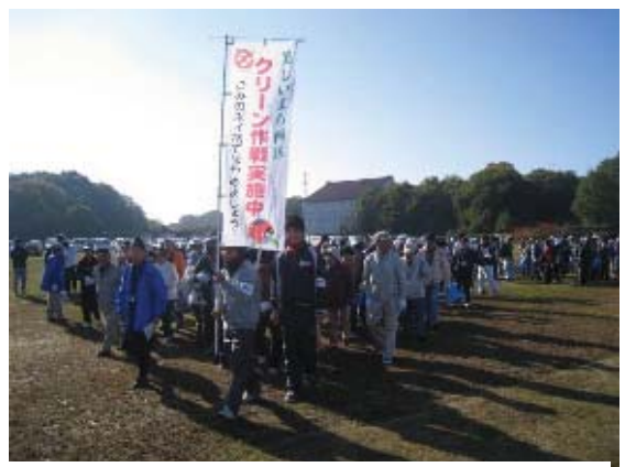
地域主体のクリーン作戦

地域活動としてクリーン作戦を実施し、暮らしに身近な地域の美化に努めます。住民主体の美化活動については、ごみの出し方・マナーの周知を図るほか、資材の提供などを通して活動を支援します。