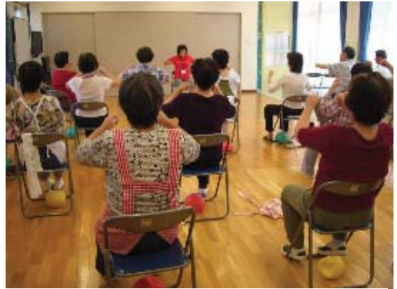
地域でのヘルスアップ活動

地域ヘルスアップ作戦推進員が取り組む健康活動に対し、運動や栄養などの幅広い情報提供や推進員に対する研修を開催し、推進員のレベルアップを図るとともに、各地域の状況に応じた健康増進活動を進めます。