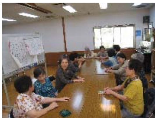
地域でのデイサービス

また、介護などの支援の必要な方に対しては、総合的、効率的な支援を行うため、えがおの窓口など福祉関係機関、あんしんすこやかセンター、地域住民の連携を強化します。