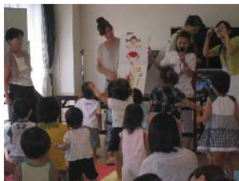
ふれあいのまちづくり協議会の活動

講座方式やワークショップなどによる効果的な研修の企画、実施や地域に出向く研修の実施など、資質の向上を図ります。