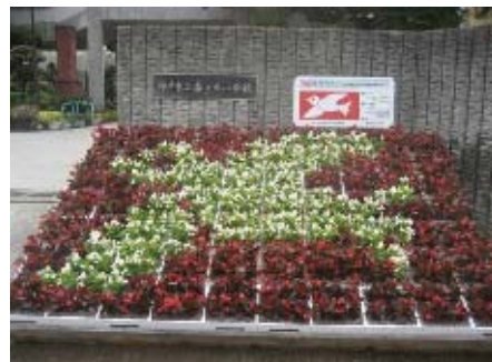
小学校での花絵花壇づくり

区内の小学校で、西区産の花壇苗を使用した花絵花壇づくりに取り組みます。また、まちなかの公園や街路などでの飾花を進め、花にあふれる潤いあるまちづくりをめざします。