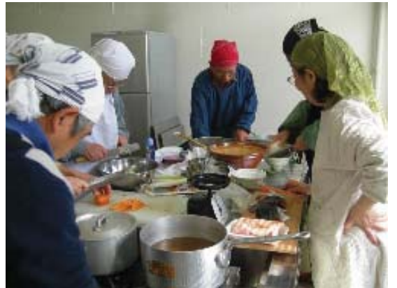
食による健康づくり

健康づくりのためには、運動や休養とともに「食」が重要な要素となります。栄養相談や早寝早起き朝ごはん運動などによる食生活習慣の改善、給食会、ふれあい喫茶などの場を利用した助言、指導を行い、「食」を通じた健康づくりを推進します。