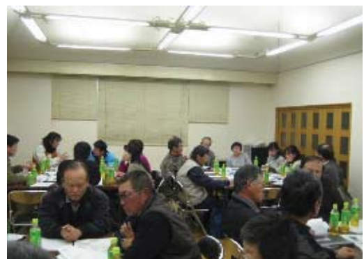
里づくり計画策定会議

里づくり活動の中で，都市部商店街と農村との交流などの地域間交流や各地域の特産品づくりといった魅力アップに繋がる取り組みに対して支援を行います。また，地域単位で取り組んでいる希少生物の保護活動については，ホームページなどを通して，その取り組みを広報します。