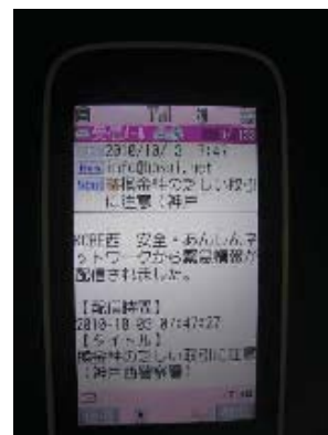
西区メール配信システム

犯罪情報など、安全安心に関する情報を多くの区民に提供する「西区メール配信システム」を普及させるとともに、青色パトロールカーの活用や門灯点灯の推進、声かけをはじめとする見守り活動などをさらに進め、地域防犯力の向上を図ります。