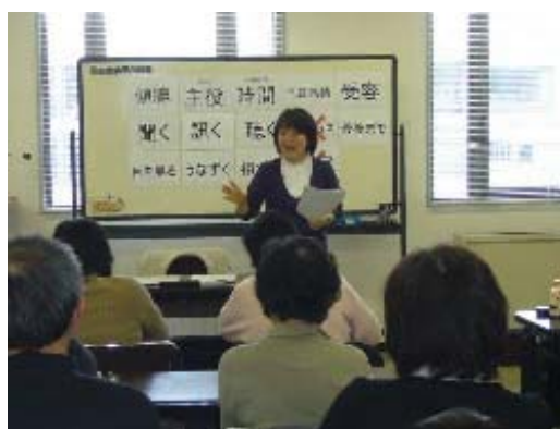
ボランティアの育成支援

高齢者層を中心とした地域住民に対してボランティア講座を実施し、ボランティアグループの結成を進め、その後の継続した活動を支援します。