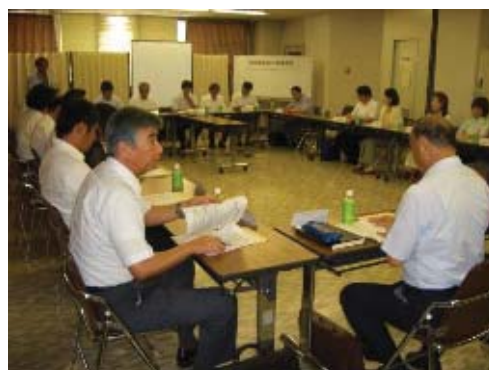
西区感染症対策連絡会

専門機関や教育・福祉関係施設など多方面からの参加のもとに立ち上げた「西区感染症対策連絡会」を基盤として情報共有ネットワークの拡充と連携強化を図り、感染症発生の早期探知および拡大の抑制に努めます。