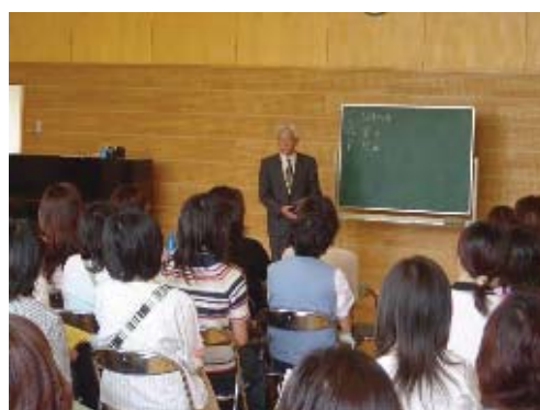
こどもへの暴力防止プログラム(CAP)

区の子育て支援室では、母子健康手帳交付時や乳幼児健診などの機会を活かして、母親などの子育ての不安解消及び虐待の早期発見に努めます。また、乳幼児健診の未受診児に対しては、子どもの安否確認を行うため、家庭訪問を実施します。児童虐待