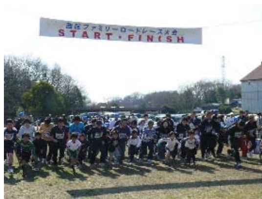
西区ファミリーロードレース大会

西区のまつり「みどりと太陽のまつり」や、地域の文化祭や音楽会など、文化・芸術に親しむ機会や発表の場を提供し、区民が身近に楽しめる機会を増やします。