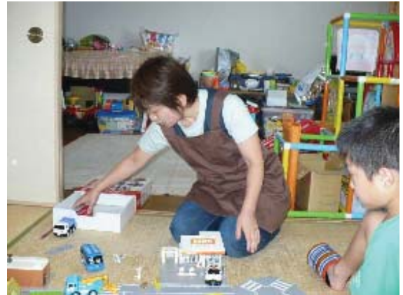
子どもと親の応援隊

乳幼児健診の機会を活用するとともに、発達障害児が通う学校・園との連携を密にすることにより、発達障害児の早期発見に努めます。あわせて児童委員などが地域の見守りを行い、相談に応じます。また、発達障害児の支援に取り組むNPOや地域団体と協働して、地域における「子どもと親の応援隊」の継続的な取り組みを進めます。