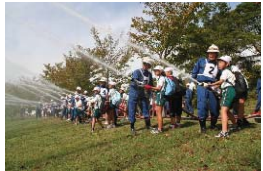
安全安心体験学習

また、各地域のジュニアチームの活動を支援するとともに、活動内容などについて相互に情報交換を行い、各チームの活動の充実を図ります。あわせて、区内全域での結成をめざし、地域への取組みを行います。