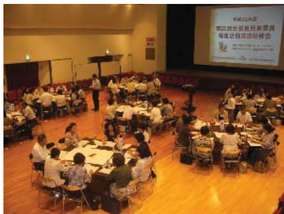
民生委員児童委員福祉活動交流研修会