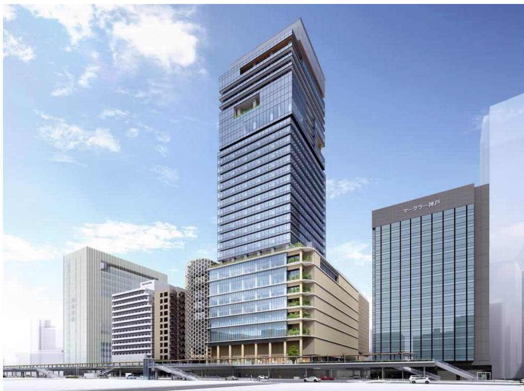
(参考1) ビル完成イメージ (外観)