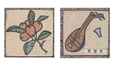
琵琶をデザインした歩道タイル

コミュニティ道路の歩道タイルには、琵琶や果物のびわをデザインしたものが整備されています。これらのデザインは、琵琶町復興住民協議会の発案により、決められたものです。