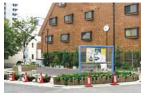
5 永手けやきひろば