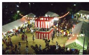
琵琶町夏まつり 盆踊り