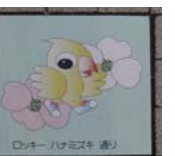
ロッキーマジック通り