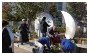
公園管理会 花苗植え