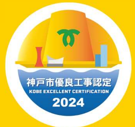
神戸市優良工事認定ロゴマーク