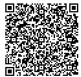
民泊相談窓口予約