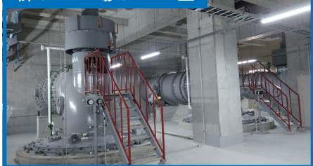
新ポンプ場ポンプ室