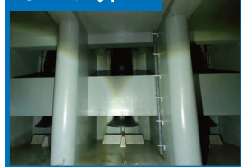
新ポンプ場 ポンプ井