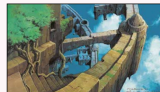
天空之城（荒凉的天空之城）1986

山本先生是日本国民公认的动画电影美术总监，代表作品有《天空之城》、《幽灵公主》等，这次展出他手绘的背景画和图像板等约250件美术设计作品。神户作为《萤火虫之墓》的社会舞台也将同时举办特别作品展。